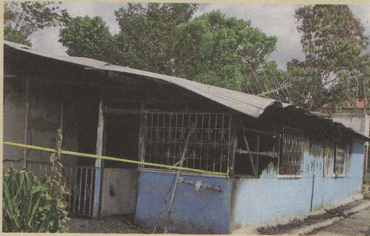
El incendio asustó a los vecinos de Santiago de Puris. MARVIN GAMBOA