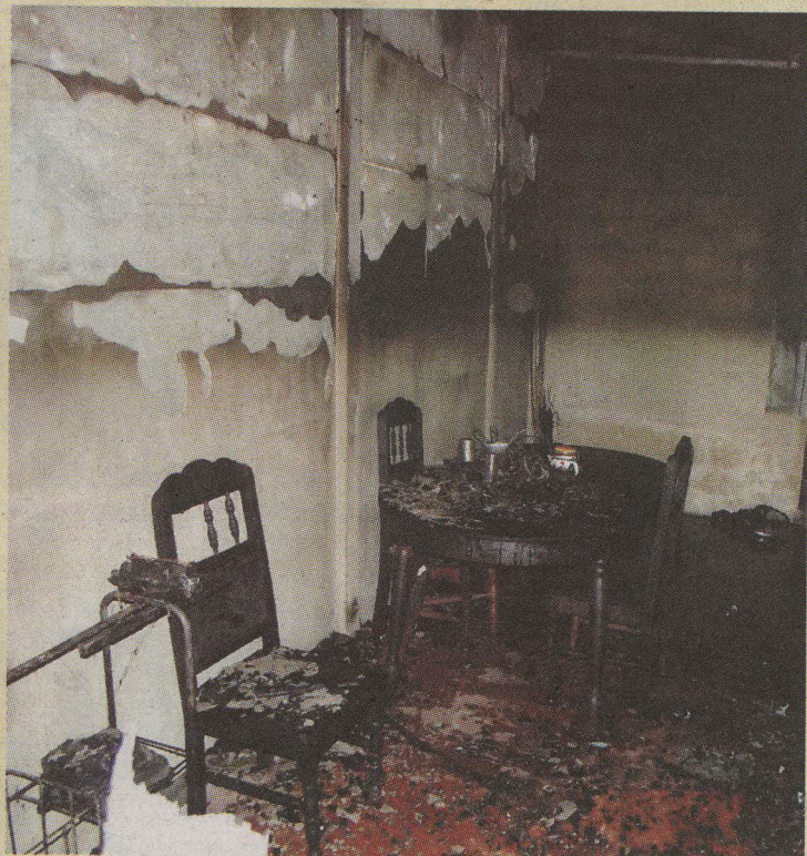
Todo quedó hecho cenizas.