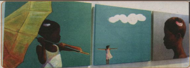
La inocencia de los niños queda al descubierto con su propuesta.

Para esta ocasión hay 16 acrílicos sobre tela y seis es-