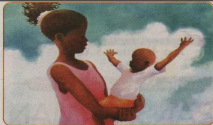
El amor y el color son fundamentales en las obras, donde se notan rostros de mujeres que tienen algo que decir.