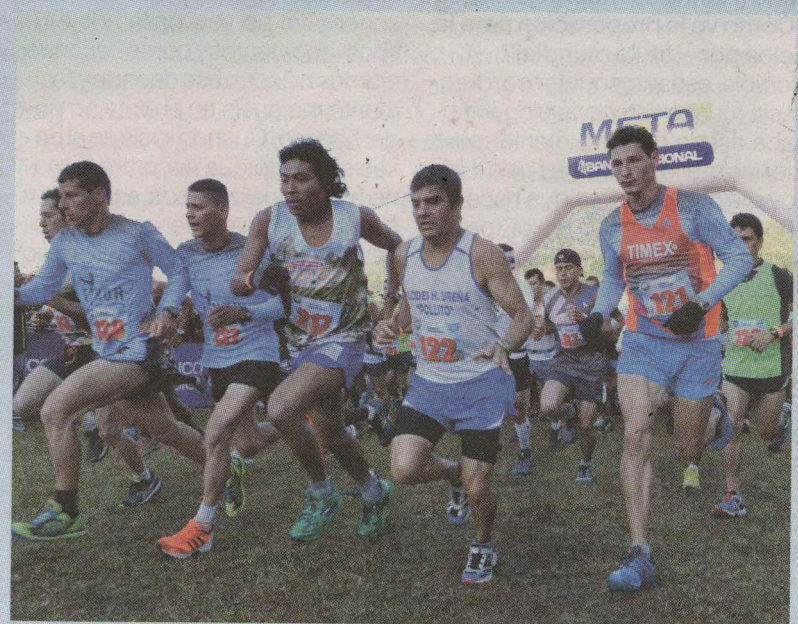
La carrera estuvo nealadísima desde el inicio