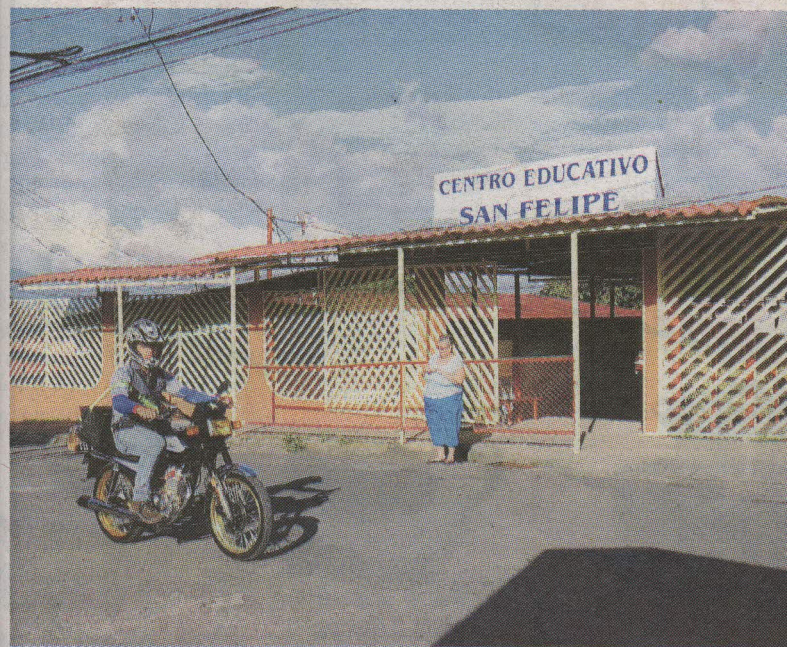
En la escuela de San Felipe se respira mucha preocupación. GRACIELA SOLÍS