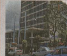
La CCSS verá si cambia el reglamento.