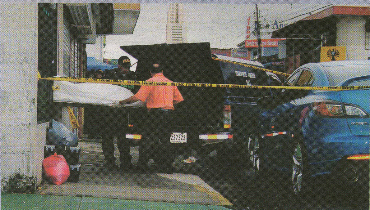
El OIJ investiga la relación que existía entre el doctor y la fallecida. WILBERTH HERNÁNDEZ GN.

“Hace una semana ella me dijo que estaba embarazada y