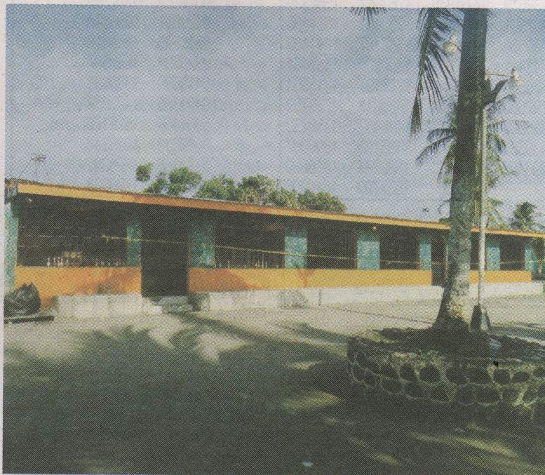
El bar B-Cool se convirtió en un campo de batalla. ESSICA SALAZAR GN.