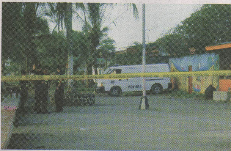
La Policía tuvo que fajarse duro con los hampones. ESSICA SALAZAR GN.

Otras siete personas también resultaron heridas. Las autoridades