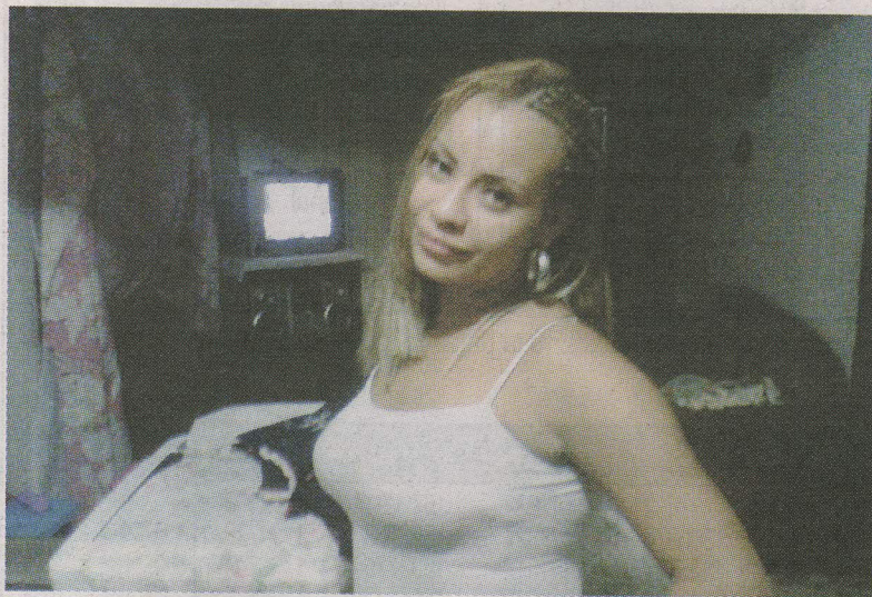
Yahaira era madre de cuatro hijos. JESSICA SALAZAR GN.