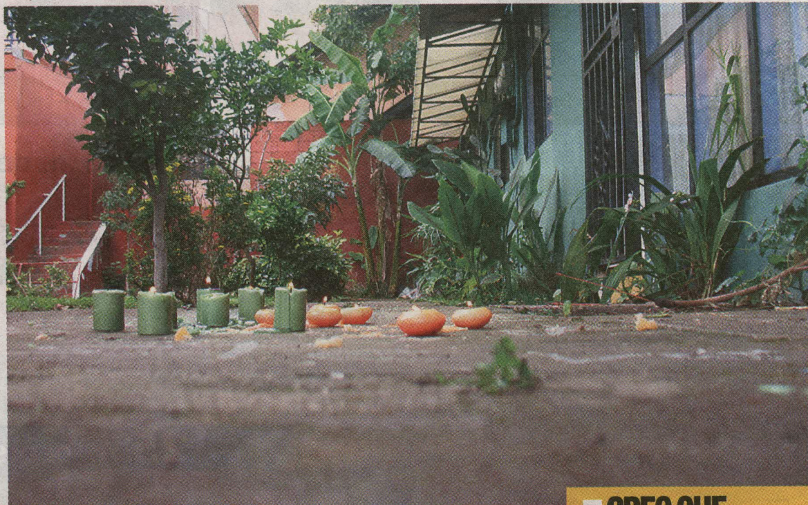
Los vecinos colocaron unas velitas donde quedó el cuerpiito del chiquito. A.

Viejo conocido. El OIJ todavía no maneja ningún móvil del crimen, lo que sí se confirmó fue que el extranjero ya tenía antecedentes