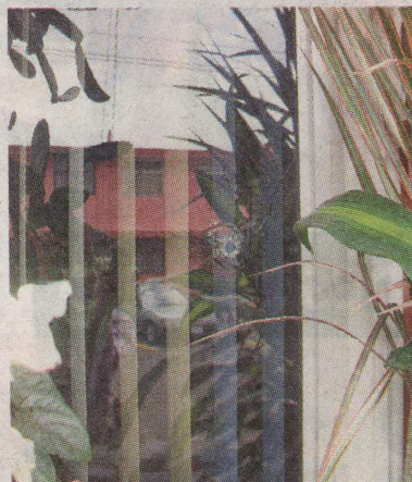
El colombiano disparó un balazo que entró por esta ventana. ANDREY