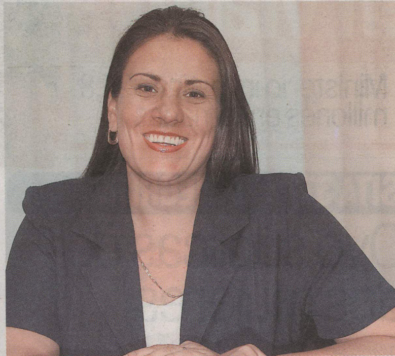
El video romántico fue hecho en un hotel de lujo en Ciudad del Cabo, en Sudáfrica.

En ese mismo documento, el Gobierno lamentó y condenó la "irresponsable" invasión a la privacidad de Bolaños y dijo esperar que se aclaren los hechos y se con-