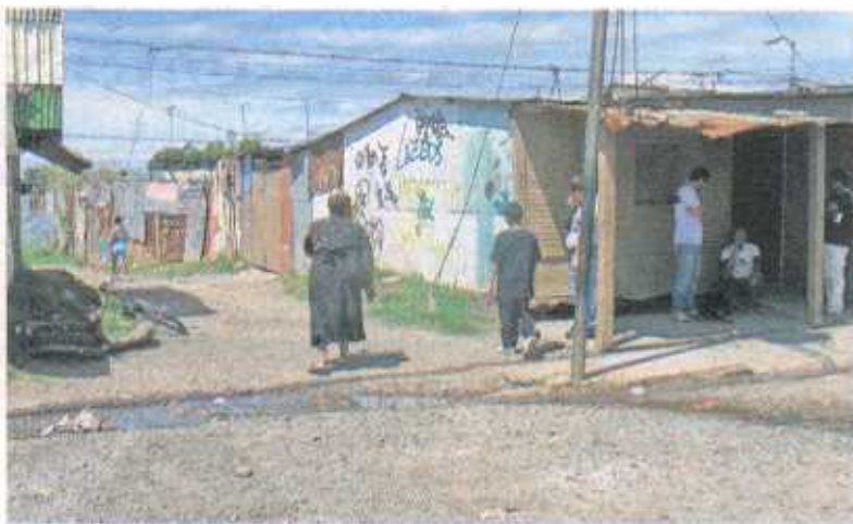
La víctima quedó sin vida en esta esquina.

Al muchacho lo tenían cerca del ICE de Pavas, dentro de un carro.