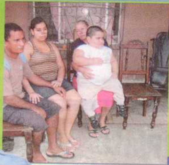
La familia es la fuerza que sostiene a Estefan para salir adelante. RÓGER AMORETTY