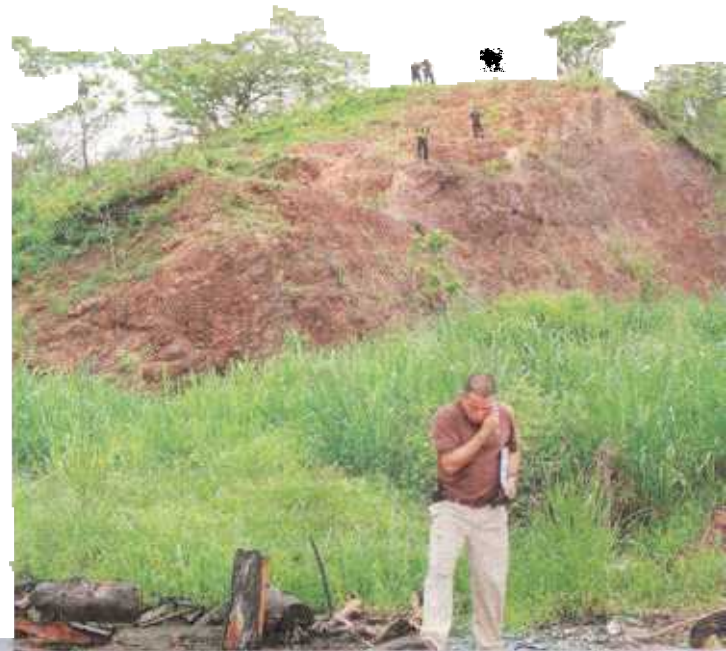
El hombre quedó muerto en el fondo del barranco.

Sin embargo, no la devolvió en toda la noche, y no supieron de la chiquita hasta ayer cuando llegó herida, toda llena de barro y con el uniforme del kínder.