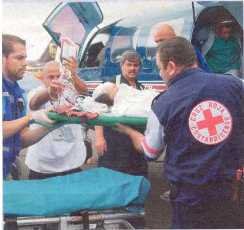
La chiquita llegó a Base Dos del Juan Santamaría y de allí la pasaron al Hospital de Niños. SHIRLEY VÁSQUEZ

Las primeras investigaciones revelaron que el hombre llegó el lunes a la casa de la mamá de la chiquita, de quien está separado des-