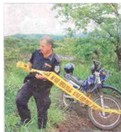
La policía vigiló el lugar mientras el OIJ levantaba el cuerpo.

de hace dos semanas, y le pidió a la niña para estar con ella un rato.