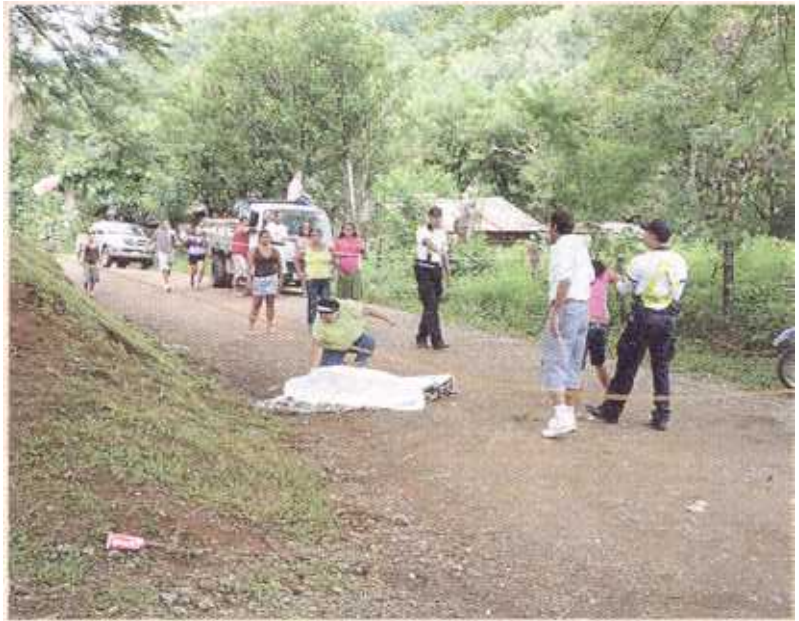
Familiares de la joven llegaron en cuanto supieron la noticia. JULIO PEÑA GN

de ayer no estaban claras, pero se cree que los celos habrían estado de por medio.