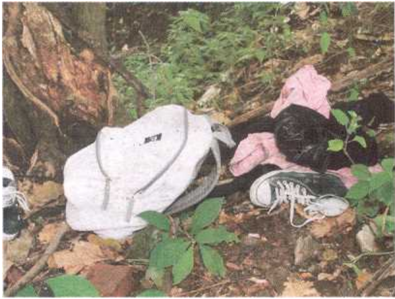
La ropa y el bulto quedaron en el lote.

Policías encontraron la ropa y el bulto de la mujer en el lote al que la metieron.