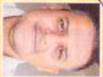
RÁNDALL CHAVES CAMARÓGRAFO

"Mal patriotas. Si apoyaran esta práctica le daría prestigio a la empresa y sería reconocida".