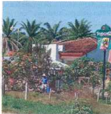
El crimen ocurrió en la discoteca Buganvilla.