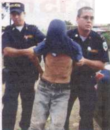
El sospechoso, de apellido Segura, quedó detenido.

El cruzrojoista Isidro Alvarado confirmó que a la señora la golpea-