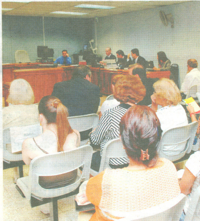
Un llenazo hubo ayer en el juicio contra Burgos.

El médico relató que la acusada se encontraba muy afectada, además dio entender que tuvo ideas suicidas.