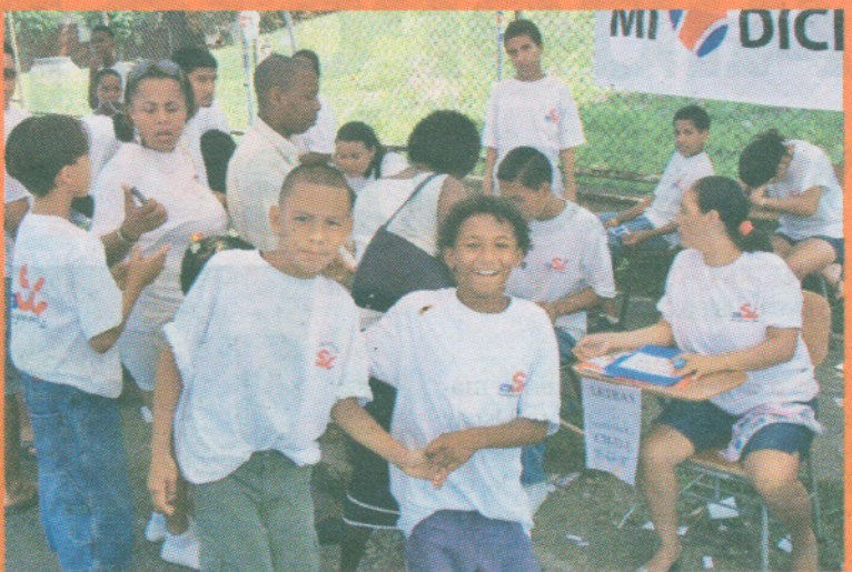
Más los adultos En Limón las cosas transcurrieron tranquilas. Según datos del TSE fueron pocos a votar y la mayoría mayores de 40 años.