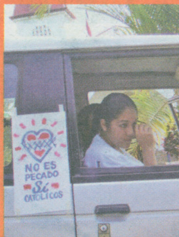
Como protesta Los del Si protestaron porque votar a favor no era pecado.