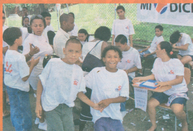
Más los adultos En Limón las cosas transcurrieron tranquilas. Según datos del TSE fueron pocos a votar y la mayoría mayores de 40 años.