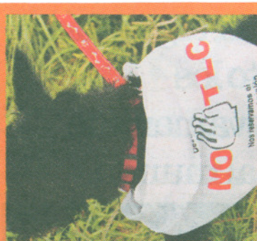
Perrito conectado A "Spike" le mandaron a hacer una camiseta.