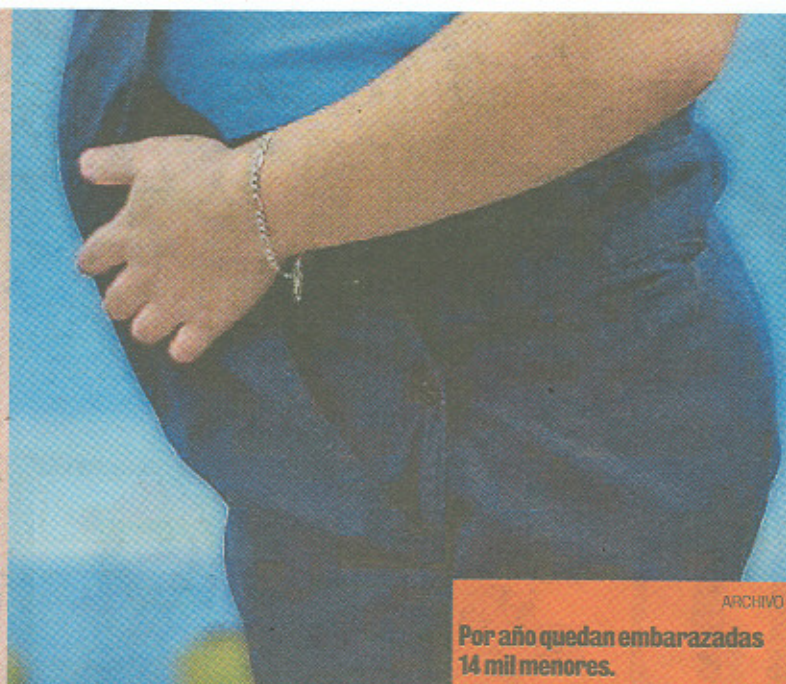
ARCHIVO Por año quedan embarazadas 14 mil menores.

sa, la escuela y desde muy pequeños. Así como le enseñamos a cruzar la calle, a no hablarle a extraños, debemos hablarles de sexo.