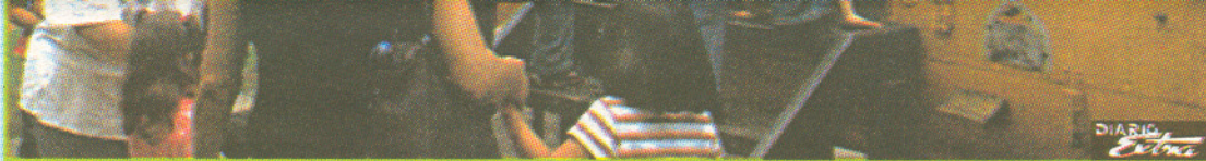
Cuando los niños y los padres juegan juntos se refuerzan los lazos de confianza y amistad entre ambos y es más fácil detectar cuándo algo le afecta o molesta.

Costa Rica es uno de los países donde más salen a jugar los niños a parques o plazas los fines de semana. Ya que a lo largo de la semana el 55% de los niños se queda en casa, y utiliza el tiempo libre en ver televisión y jugar con sus hermanos, pero el fin de sem-