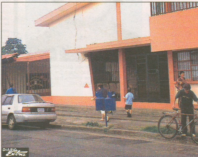
Los hechos habrían ocurrido en la Escuela Juan Rafael Meoño, en El Llano, Alajuela.