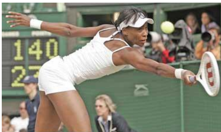
Venus Williams va por su cuarto título de Wimbledon contra la sorpresa del certamen, Marion Bartoli.

La desconocida Marion Bartoli eliminó en semifinales a Justine Henin