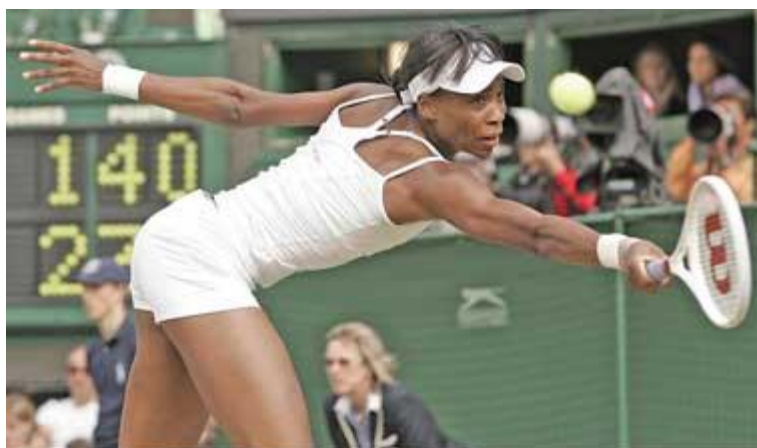
Venus Williams va por su cuarto título de Wimbledon contra la sorpresa del certamen, Marion Bartoli.

La desconocida Marion Bartoli eliminó en semifinales a Justine Henin