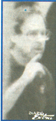
Greg fue llevado a la cárcel. (SEP).

El hombre le gritó que tocara antes de en-