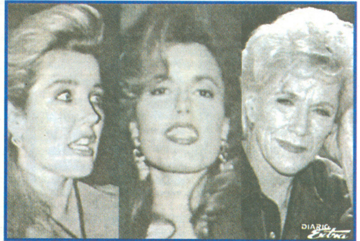
Las tres mujeres que vaporearon al gerente. (SEP).

trar y ella se disculpó cerrando la puerta. El secreto estaba ya revelado: ¡Su jefe veía pornografía por Internet!