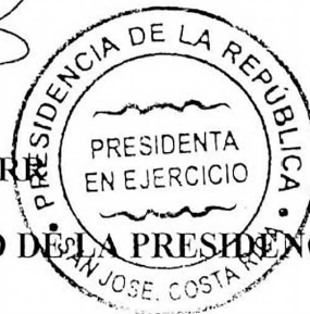
EPSY CAMPBELL BARR

LA PRIMERA VICEPRESIDENTE EN EJERCICIO DE LA PRESIDENCIA DE LA REPÚBLICA