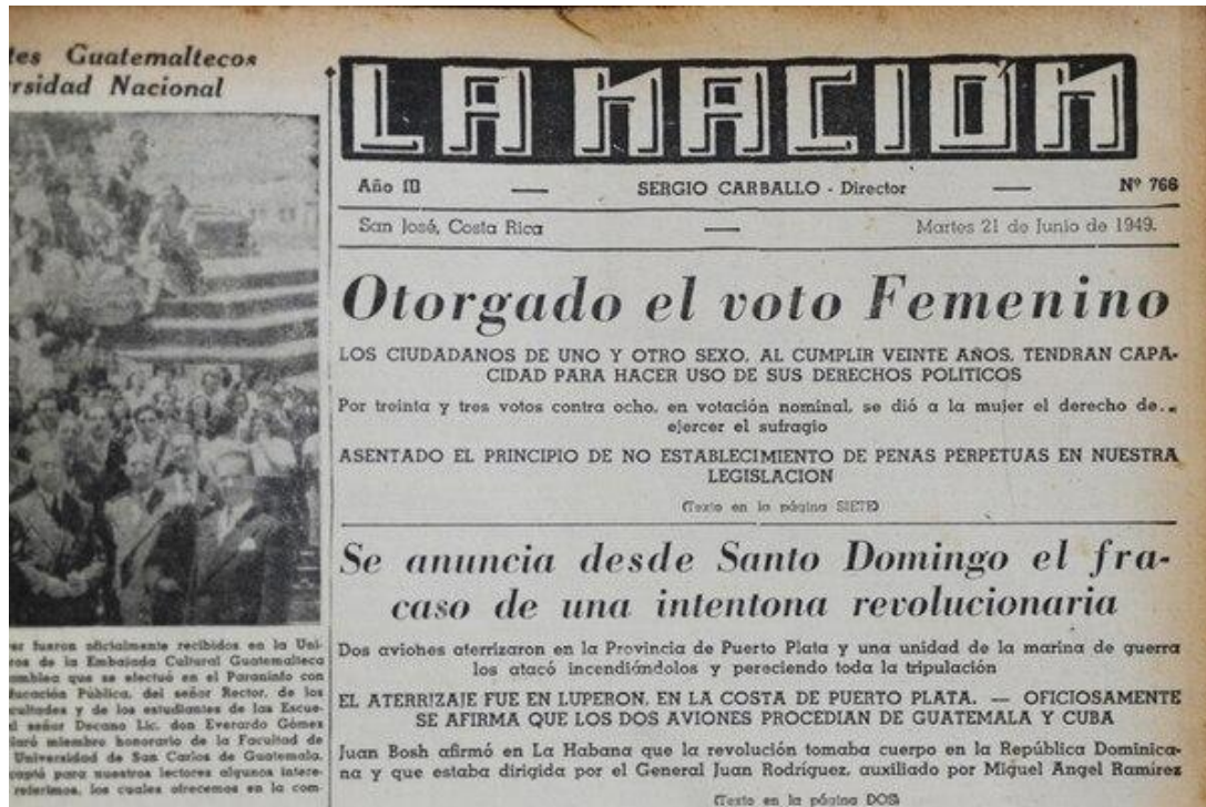
Fotografía extraída de artículo periodístico de la Nación (2014); La batalla de las sufragistas ticas