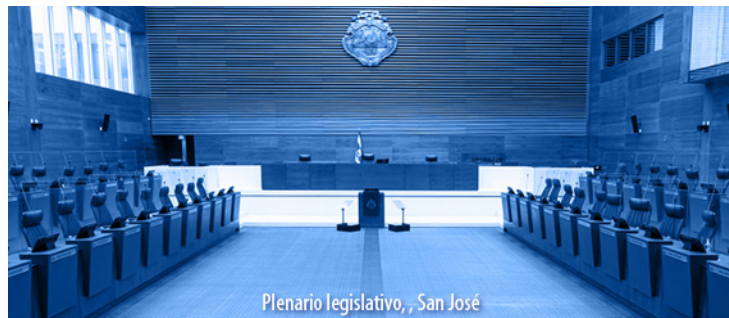
Plenario legislativo, San José