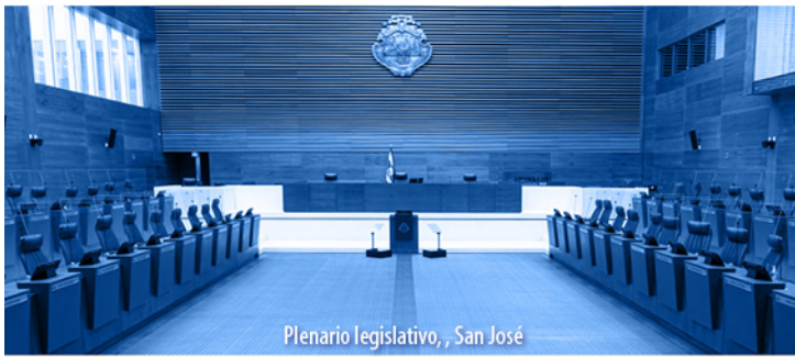
Plenario legislativo, San José