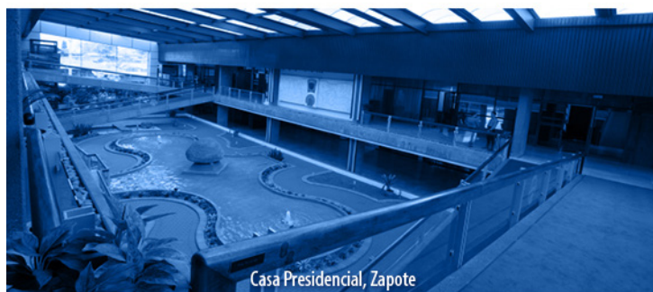
Casa Presidencial, Zapote