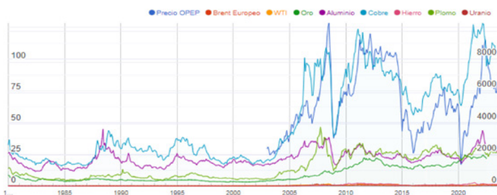
Gráfico 1. Evolución del precio de las materias primas en dólares

El fenómeno mencionado es la guerra entre Rusia y Ucrania que tuvo múltiples implicaciones en las economías globalizadas del siglo XXI. En primer lugar, el conflicto generó recurrentes interrupciones en el flujo de materias primas como el petróleo, gas, aluminio, entre otros, que son clave para los países que no son productores, lo cual incrementó el precio de estas (gráfico 1), pero, además, influyó en los costos de producción de otras actividades como la agricultura.