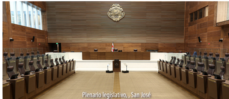
Plenario legislativo, San José