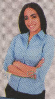
SU MAMA MARCE