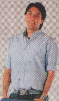
SU PAPA JUAN