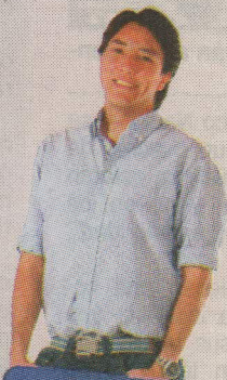
SU PAPA JUAN