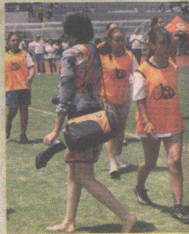
A la fotógrafa no le quedó de otra que andar a pata pelada. ROY CHINCHILLA.

♦ ROY CHINCHILLA U. roychinchilla@lateja.co.cr