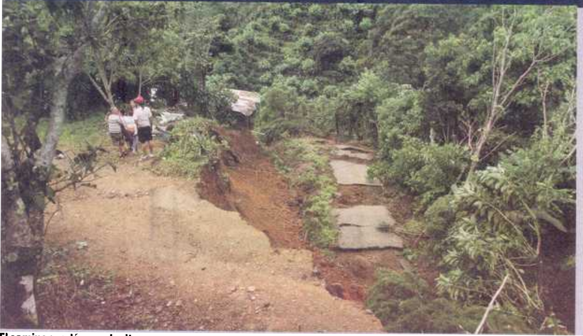
El camino quedó en pedacitos.