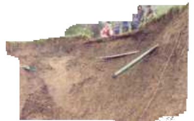
El pueblito quedó aislado hasta quien sabe cuándo.