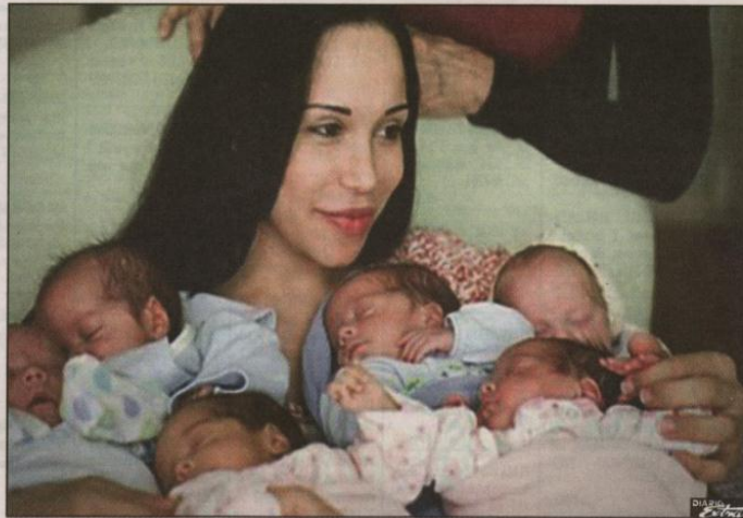
Los seis varones y las dos niñas nacieron en cinco minutos por cesárea, pesaron entre 880 gramos y 1,47 kilos. El equipo de 46 médicos y asistentes esperaban "sólo" siete bebés y estaban muy sorprendidos cuando descubrieron el octavo. Dos requirieron ser entubados. (SEP)

Es más, durante estos once años Suleman inició tratamientos nuevos