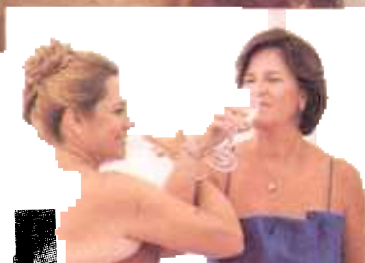
Las ticas tuvieron una boda de ensueño en la que se veían bellísimas.