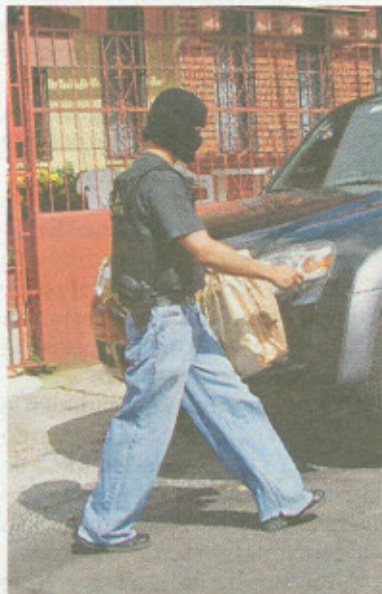
Agentes del OIJ recogieron pruebas en la casa de la joven. EDO VILLALOBOS LT

Las autoridades confirmaron que don "Leo" hizo un pago de €6