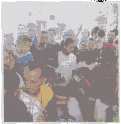
La joven fue sepultada ayer en la tarde en Limón.

Mucha gente se unió al dolor de la familia y estuvo con ella en este momento tan difícil.