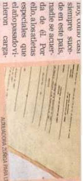
ALBERCA EN ZUMBA PARA UN