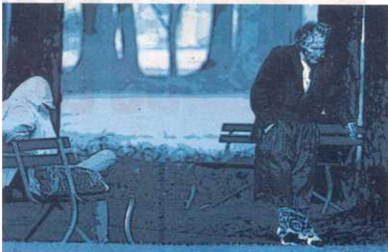
Al sospechoso lo dejaron libre tras el ataque. ILUSTRACIÓN FREDDY SOLÍS LT

Esá agresión ocurrió la semana anterior. El enfermo fue detenido el miércoles y puesto en libertad