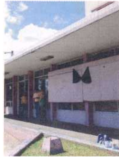
En el hospital de la Mujer están de luto. REBECA ARIAS LT