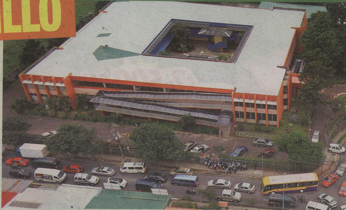
Las presas no son un secreto, Chepe es un caos vial después del hueco.

Más oficiales. Además, pondrán a bretear a 120 tráfico más en