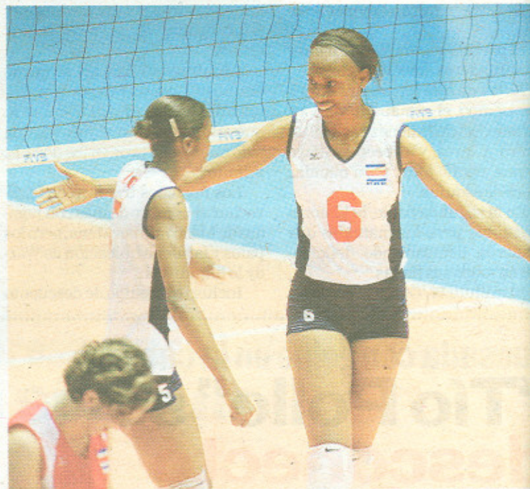
Las muchachas han tenido que hacer grandes esfuerzos para triunfar.

Según informó Solano, la delegación nacional regresa al país hoy a las 11 de la noche en un vuelo de Mexicana.