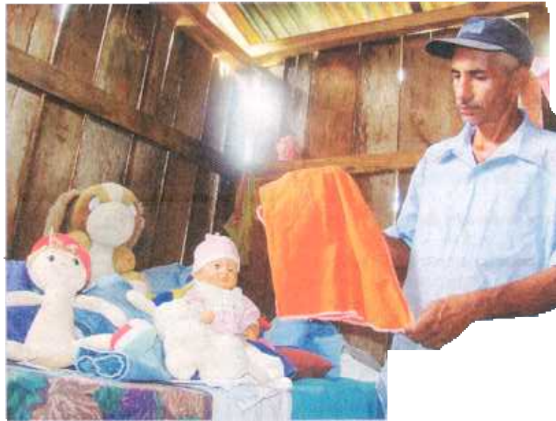
Parte de la ropita de la chiquita quedará de recuerdo

... en una camisa sospechoso, de apellido Boniche, podrían confirmar que es el asesino de niñas de 12 años encontradas muertas a 800 metros de su casa. Recorrieron la zona, a la pequeña la asfalaron y luego la enterraron en un hoyo, en el barrio donde vivía la víctima, al sur de Río Celeste, en Guatuso.