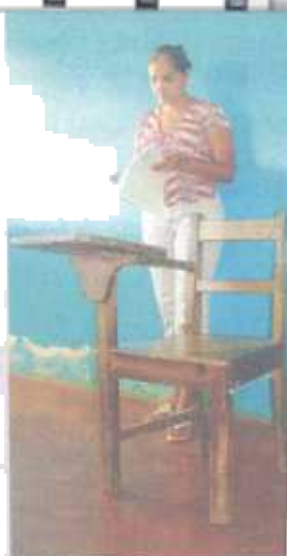
La menor de edad estudiaba en la escuela de Río Celeste. EDGAR PARALT

“Espero que si encuentran todas las pruebas, lo condenen. Estoy seguro de que mi sobrino la mató. Lo extraño es que él era muy cari-