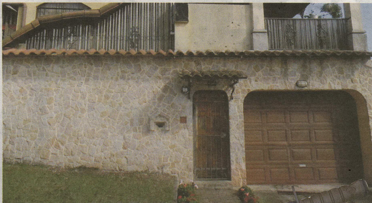
Hurtado se subió por la tapia para meterse al segundo piso. FELIPE ARRIETA

“Llegó de la nada, se brincó el muro y atacó. Mi hermana venía llegando, como son apartamentos no nos dimos cuenta, él gritaba y