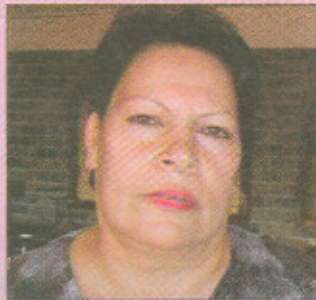
JORGE CALDERÓN PARA LT