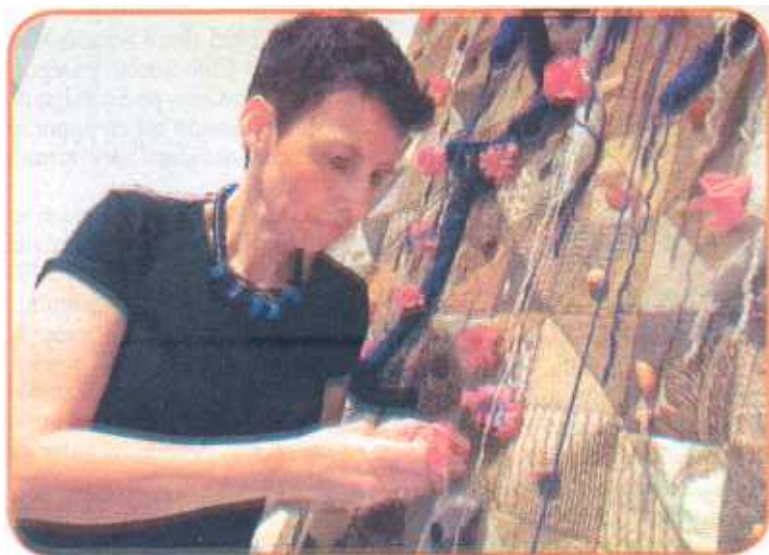
Sus trabajos están llenos de sentimientos, formas, trazos e historia internacional, que la marcaron para siempre y sirvieron de inspiración.

y durante jueves y viernes de Semana Santa esta sala estará cerrada.