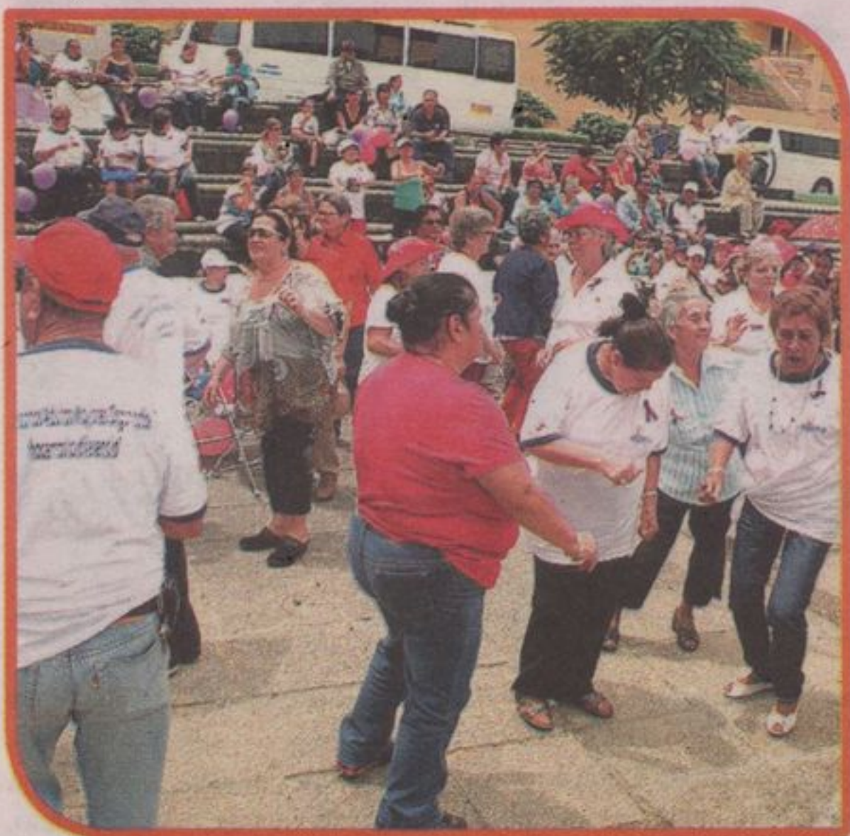
Una gran cantidad de adultos mayores participaron de la actividad organizada por Ageco en la Plaza de la Democracia.